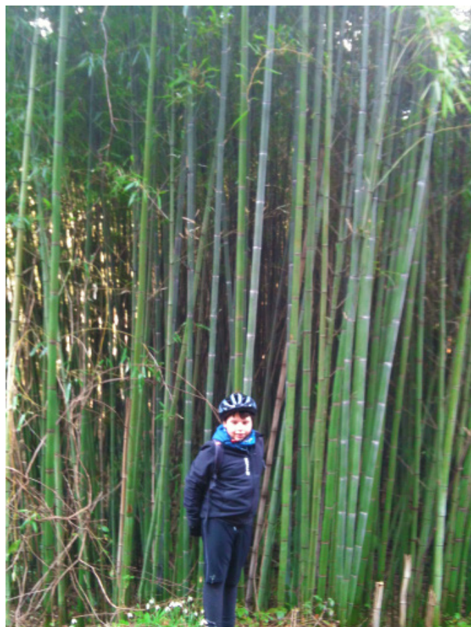
La foresta di bambu'