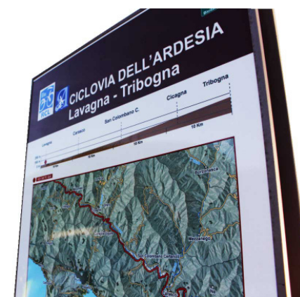
La segnaletica lungo il percorso

Si procede verso valle in direzione Cicagna costeggiando il torrente Lavagna, il percorso rimane molto ombrato in estate, per cui e' tranquillamente pedalabile anche nelle ore piu' calde, un protezione in legno delimita il sentiero e la ritroveremo fino alla fine del percorso a mare.