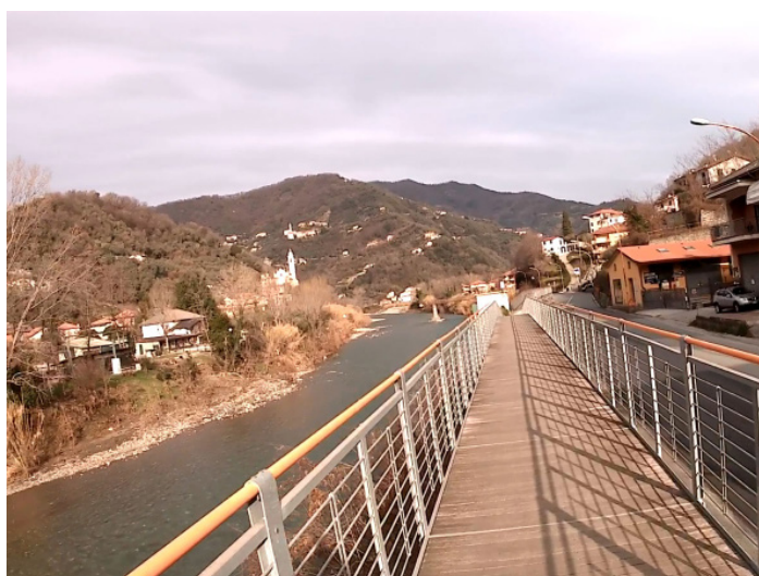
La passerella nei pressi Carasco

Ci siamo, il percorso giunge quasi al suo termine, qui dobbiamo per forza rimetterci sulla careggiata ma giusto per un breve tratto, ci troviamo piu' o meno al bivio per la Val D'Aveto, da qui una passerella di legno lato fiume ci tutela dal traffico ed eccoci arrivati alla pista ciclabile tra Chiavari e Lavagna.